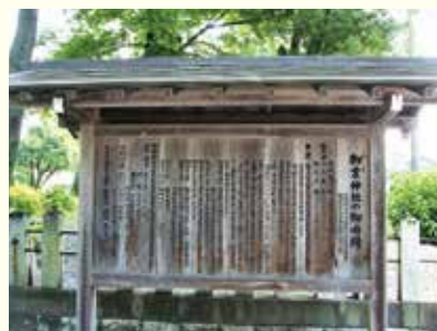
御裳神社の御由緒

平安時代の朝廷、戦国の世の武士、この地を治めた尾張藩主、そして明治から現代へ、それぞれの時代に生きた人たちが、末永い繁栄や安全・安心な世の中と暮らしを願ってきました。いにしえの時代から現在まで、地元の人たちに敬い護られてきた御裳神社。これからもその願いが託されていきます。100年後にはどんな人たちが訪れるのでしょうか？